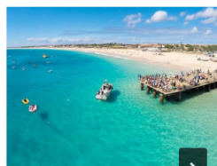
Ministro do Turismo de